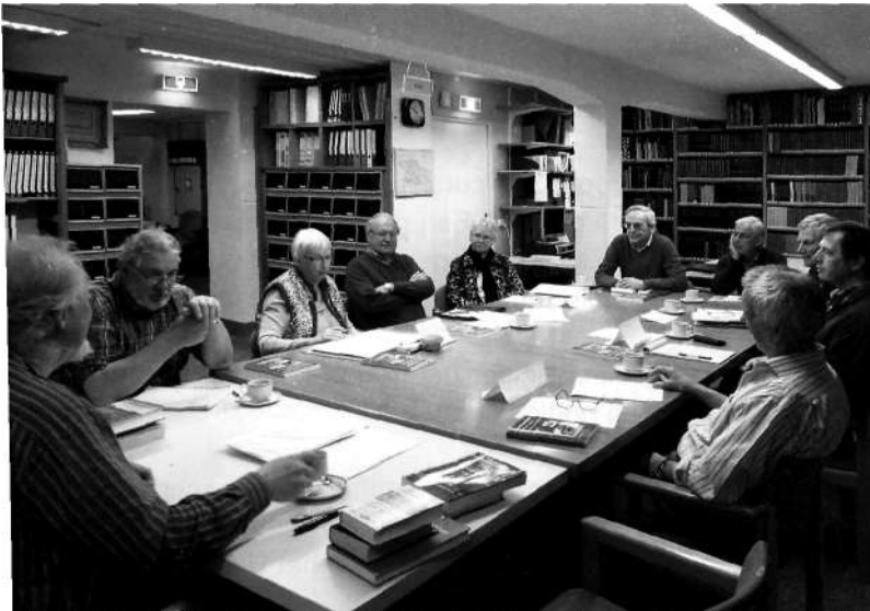
Een aandachtige groep deelnemers tijdens de ochtendsessie "Hoe schrijf ik geschiedenis"

Datje samen als verenigingen iets tot stand kunt brengen is onlangs weer gebleken. Bij het Historisch Centrum Overijssel (HCO) in Zwolle werd vorig jaar de cursus "Hoe schrijf ik geschiedenis" gestart. Zwolle ligt echter niet naast de deur, vandaar dat