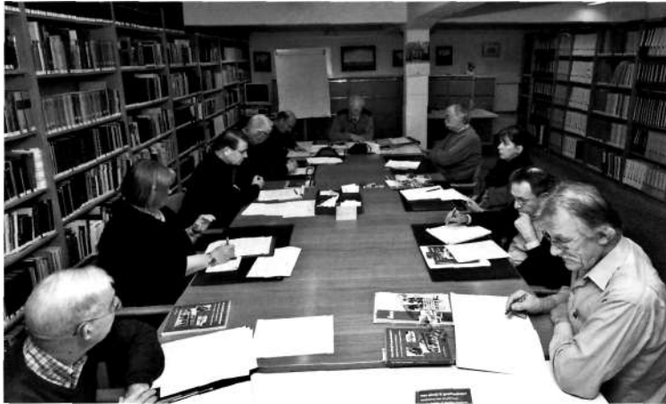
Het De enthousiaste groep deelnemers tijdens de cursus "Lay-out/website"

De middaggroep maakte eerst een analyse van hun eigen verenigingsblad en hun website. Bijvoorbeeld wat is goed en waar liggen punten van verbetering? Daarbij stond de inhoud, de vormgeving en de leesbaarheid centraal. Bovendien werd duidelijk dat de samenstelling en de werkwijze van de redacties niet alleen belangrijk is maar dat ook de samenwerking van beide redacties van belang is.