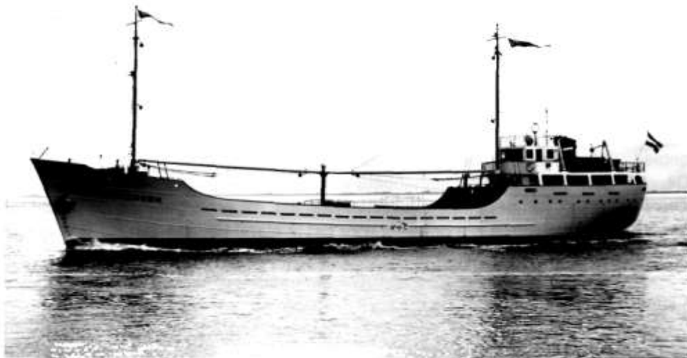
De kustvaarder die bij zijn tewaterlating de naam "Haaksbergen" kreeg.

rap tempo nog vijf zusterschepen van de Albergen. De schepen waren bemeten als Kleine Handelsvaarders, ook wel kustvaarders genoemd. Kustvaarder was een toen al verouderde benaming, want men bevoer de gehele wereld met deze kleine scheepjes.