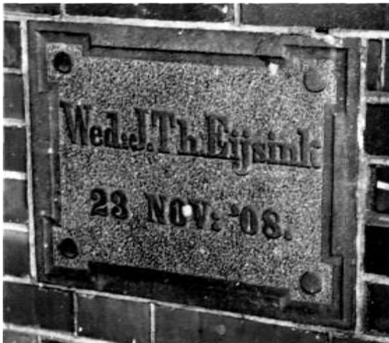
Naast de voordeur is een eerste steen ingemetseld met daarop de naam en het bouwjaar.

oom was geweest. Die had een nieuw huis gebouwd verderop aan de Enschedesestraat, voorbij het autobedrijf van Diepemaat. Wanneer ik door de Spoorstraat loop, denk ik toch altijd weer: "Daar staat het huis waar ik na mijn geboorte gewoond heb en waar ik een deel van mijn kindertijd heb doorgebracht." Het huis was geen eigendom van mijn ouders. Zij hadden het gehuurd van Eijsink van café De Klok (nu de plek van de Rabobank). Bij de voordeur is een eerste steen in de muur gemetseld met de naam van de weduwe J. Th. Eijsink en de datum 23 november 1908. In